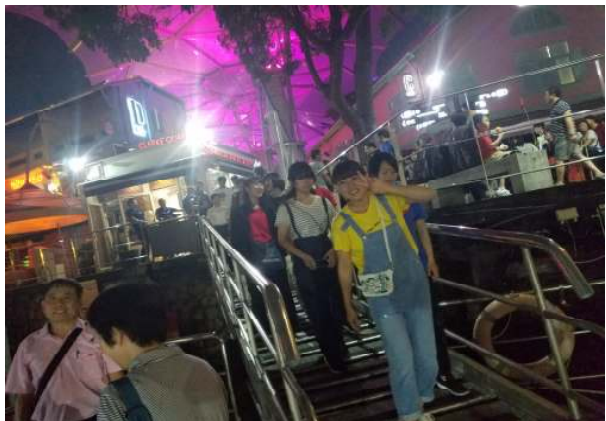
海外修学旅行（シンガポール：ナイトクルーズ）