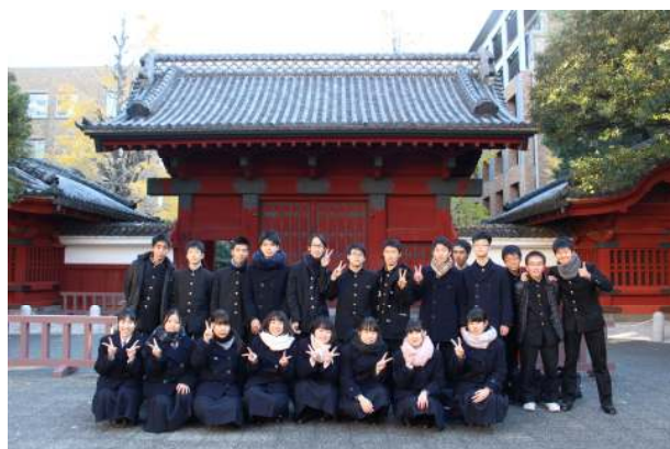
論理コミュニケーション（議論会）